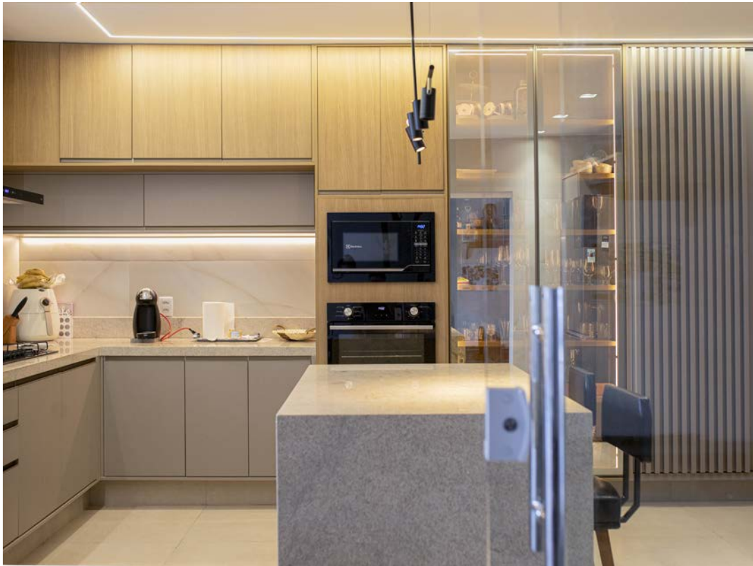
O espaço de preparos gastronômicos tem muitos armários para armazenamento, para facilitar a vida. Uma ilha de apoio, com par de banquetas para refeições rápidas, e uma linda cristaleira completam o ambiente.